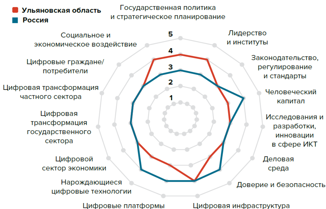
Рисунок 1. Сравнительные данные оценки уровня развития цифровой экономики России и Ульяновской области

Выгодными по сравнению с общероссийскими позициями Ульяновской области оказались по таким параметрам оценки, как «государственная политика и стратегическое развитие», «лидеры и институты», а также «социальное и экономическое воздействие».